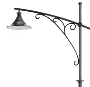
wysięgnik jednoramienny / single boom