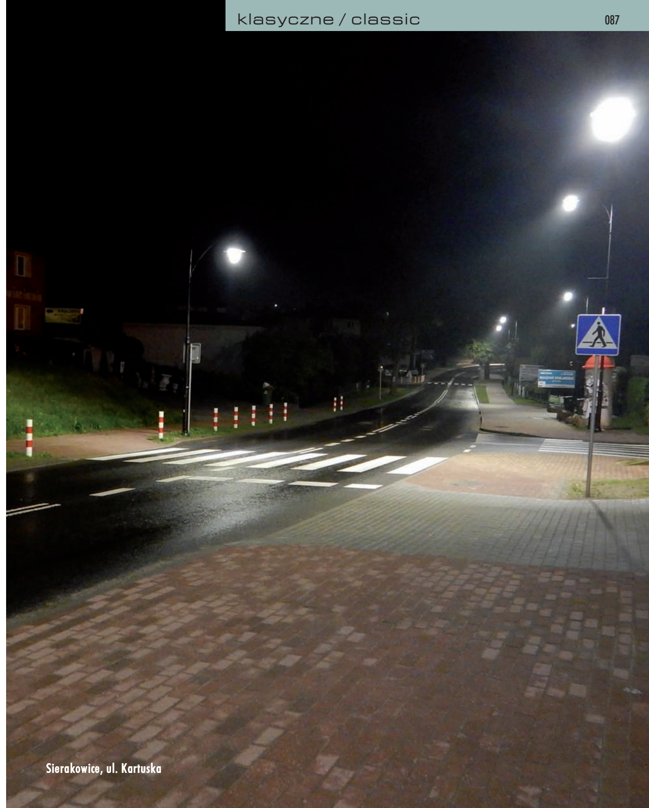
Sierakowice, ul. Kartuska