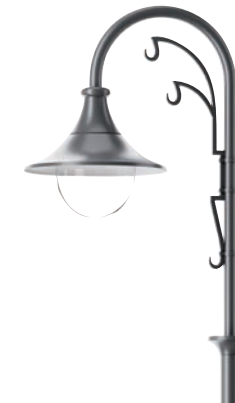
wysięgnik jednoramienny / single boom