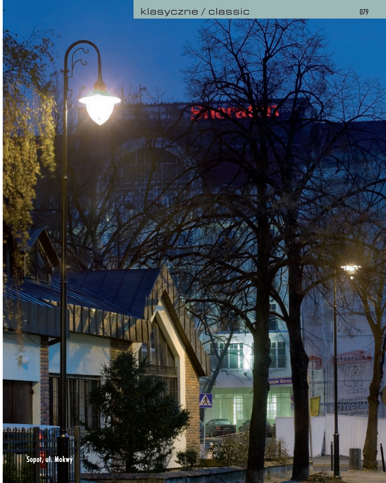
Sopot, ul. Mokwy