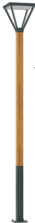
WALIA D LP 3,5 S/AS