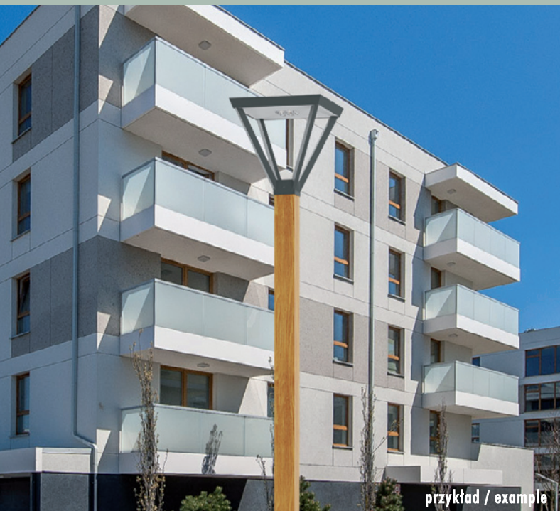
przykład / example