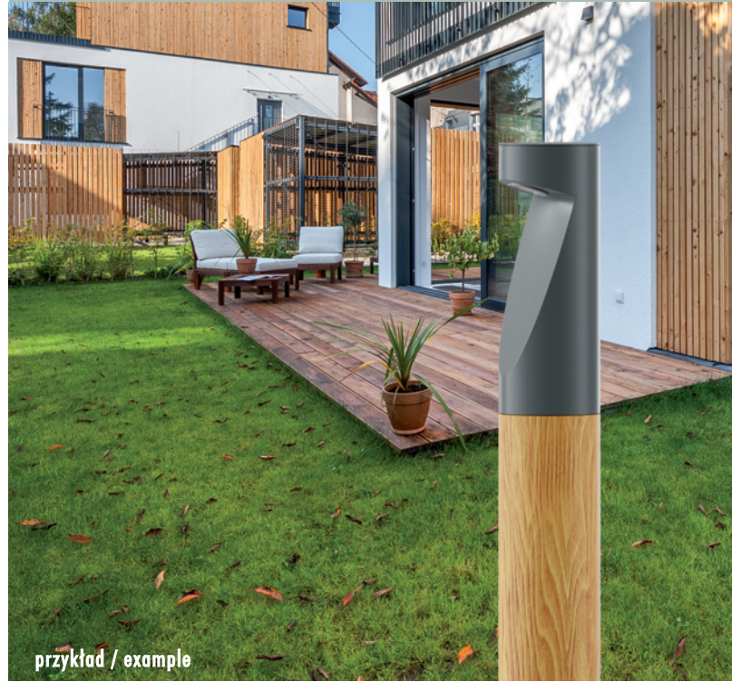
przykład / example