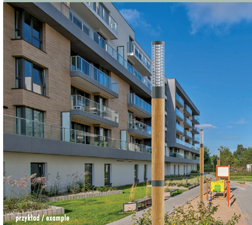
BOLARD D LP 3,5