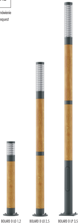
BOLARD D LO 1,2