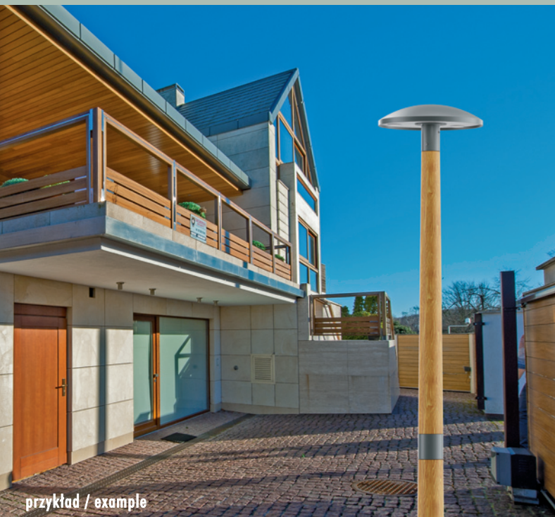
przykład / example