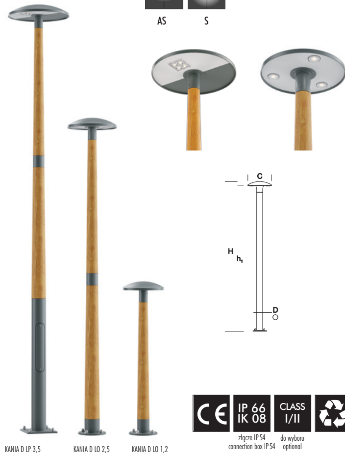
KANIA D LP 3,5