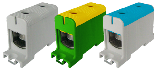
UKM 2x35-240mm 2