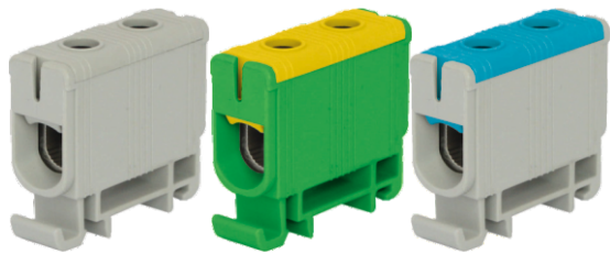
UKM 2x35-150mm 2