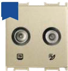
Cod: P-T0.TV.SAT.F.DR Priză TV/SAT de capăt 2M dore