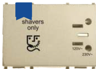
Cod: P-TOPR.DR Priză ptr. aparat de ras 110/230V 3M dore