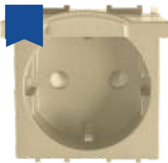
Cod: P-TOS.CAP.DR Priză schuko 2P+E protecție copil + capac 16AX 250V