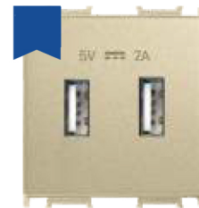
Cod: P-T0.USB.2M.DR Priză USB 2M 2A 5V dore