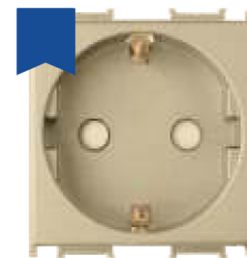
Cod: P-TOS.DR Priză schuko 2P+E cu prot. copil 2M 16AX 250V