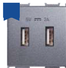
Cod: P-TO.USB.2M.AN Priză USB 2M 2A 5V antracit