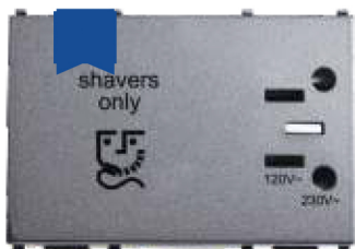
Cod: P-TOPR.AN Priză ptr. aparat de ras 110/230V 3M antracit