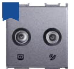
Cod: P-TO.TV.SAT.F.AN Priză TV/SAT 2M antracit