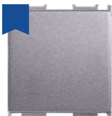
Cod: P-T01.AN.C2M Capac întrerupător simplu 2M antracit