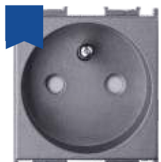
Cod: P-TOS.UPS.AN Priză simplă 2P+E standard FR UPS prot. copil 16A 250V