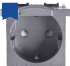
Cod: P-TOS.CAP.AN Priză schuko 2P+E -prot. copil și capac 16AX 250V