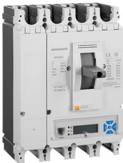
■ Înteruptoare automate compacte MX, mărime 3