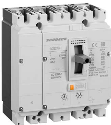
■ Înteruptoare automate compacte MX, mărime 2