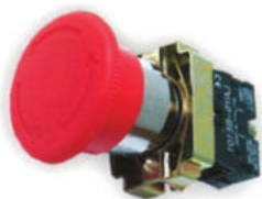
Buton ciupercă roșu 40 mm