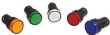
Lămpi de semnalizare