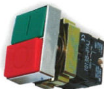
Buton dublu roșu/verde