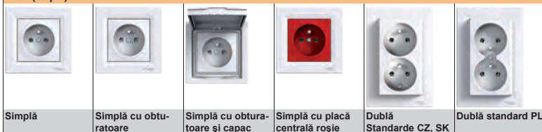
Simplă Simplă cu obturatoare Simplă cu obturatoare și capac Simplă cu placă centrală roșie Dublă Standarde CZ, SK Dublă standard PL