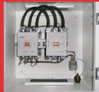
Tablou ATS, standard, automat, echipat cu 2 contactori interblocați electric și mecanic