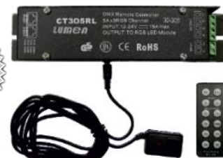
05-057 reglaj cu telecomanda(IR) - 15A se poate conecta cu consola DMX-512 se poate conecta la calculator