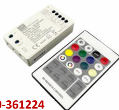
30-361224 RGB sau RGB + ALB reglaj cu telecomanda(RF) 15A