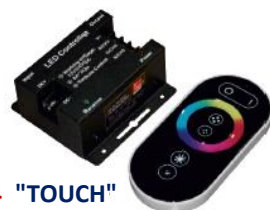
30-33324 "TOUCH" reglaj cu telecomanda(RF) - 24A Telecomanda poate functiona cu mai multe receptoare simultan in functie de setarile efectuate