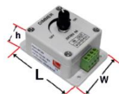
05-0502 reglaj manual aparent - 8A