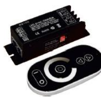
30-33325 "TOUCH" reglaj cu telecomanda(RF) - 25A Telecomanda poate functiona in paralel cu mai multe receptoare simultan in functie de setarile efectuate