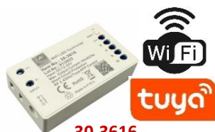
30-3616 RGB sau RGB + ALB reglaj prin telefon/tableta - 15A se conecteaza din program Tuya compatibil cu Google Home si Apple nu contine telecomanda