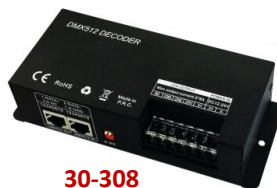
30-308 reglaj cu consola DMX-512 - 24A se conecteaza cu consola DMX-512 prin cablu UTP cu stecher RJ45 sau prin cablu cu stecher XLR3 nu contine telecomanda