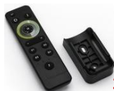
30-367 telecomanda 4zone pentru 30-3625