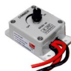
05-0503 reglaj manual aparent - 16A