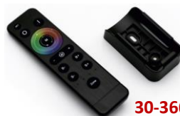
30-366 telecomanda 4zone pentru 30-3616 RGB sau RGB + ALB