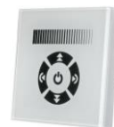
30-3380 "TOUCH" reglaj manual ingropat - 8A