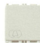
14008.2.C.SL 10 A, simbol clopotel - 2 module. Adâncime: 24 mm