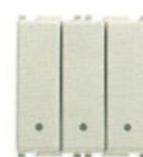
14007.SL Înterupător triplu 20 AX - 2 module. Adâncime: 30,6 mm