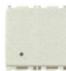
14008.2.SL 10 A - 2 module. Adâncime: 24 mm