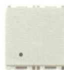
14008.FX.2.SL 10 A - 2 module. Adâncime: 25,7 mm