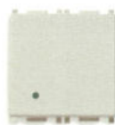
14008.2.SL 10 A - 2 module. Adâncime: 24 mm