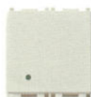
14008.FX.2.SL 10 A - 2 module. Adâncime: 25,7 mm