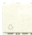
14008.2.L 10 A, Simbol bec - 2 module. Adâncime: 24 mm