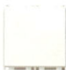
14008.FX.2 10 A - 2 module. Adâncime: 25,7 mm