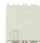
14008.2.L.SL 10 A, Simbol bec - 2 module. Adâncime: 24 mm