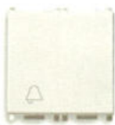
14008.2.C 10 A, simbol clopotel - 2 module. Adâncime: 24 mm