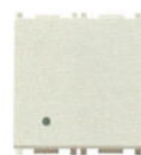
14006.2.SL 20 AX - 2 module. Adâncime: 24 mm