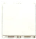
14008.2 10 A - 2 module. Adâncime: 24 mm