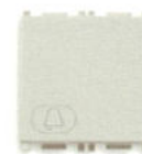
14008.2.C.SL 10 A, simbol clopotel - 2 module. Adâncime: 24 mm