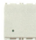
14013.FX.2.SL 16 AX, - 2 module. Adâncime: 25,7 mm