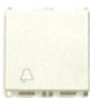
14008.2.C 10 A, simbol clopotel - 2 module. Adâncime: 24 mm