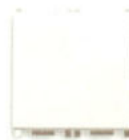
14013.FX.2 16 AX, - 2 module. Adâncime: 25,7 mm