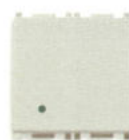
14008.2.SL 10 A - 2 module. Adâncime: 24 mm