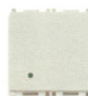
14013.2.SL 16 AX - 2 module. Adâncime: 24 mm