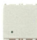
14008.FX.2.SL 10 A - 2 module. Adâncime: 25,7 mm