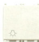
14008.2.L 10 A, Simbol bec - 2 module. Adâncime: 24 mm