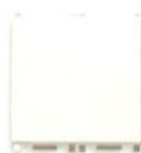
14013.2 16 AX - 2 module. Adâncime: 24 mm