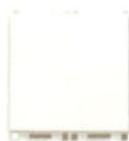
14006.2 20 AX - 2 module. Adâncime: 24 mm