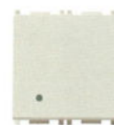
14006.2.SL 20 AX - 2 module. Adâncime: 24 mm