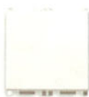
14008.2 10 A - 2 module. Adâncime: 24 mm