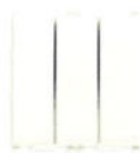
14007 Înterupător triplu 20 AX - 2 module. Adâncime: 30,6 mm