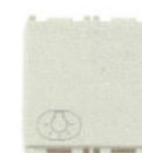
14008.2.L.SL 10 A, Simbol bec - 2 module. Adâncime: 24 mm