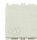
14008.2.C.SL 10 A, simbol clopotel - 2 module. Adâncime: 24 mm