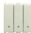
14007.SL Înterupător triplu 20 AX - 2 module. Adâncime: 30,6 mm