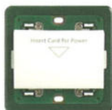
14466 Înterupător badge. Adâncime: 27,4 mm