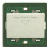
14466.SL Înterupător badge. Adâncime: 27,4 mm