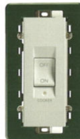
14019.SL Înterupător 45 A, ON/OFF. Adâncime: 22,5 mm