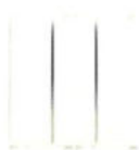
14003 Întrerupător triplu 20 AX - 2 module. Adâncime: 24 mm