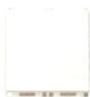
14042 Modul blanc - 2 module. Adâncime: 10 mm