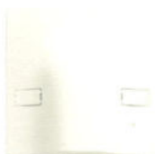
14047 2 Colier cablu 45 A cu bloc de borne. Adâncime: 20 mm