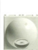
14046.SL 2 Colier cablu 20 A cu bloc de borne. Adâncime: 22,1 mm