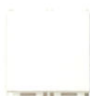
14002.2 20 AX, - 2 module. Adâncime: 24 mm