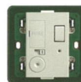
14049.SL 3 Unitate de conexiune 13 A cu întrerupător și siguranță de protecție. Adâncime: 20,4 mm