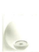
14046 2 Colier cablu 20 A cu bloc de borne. Adâncime: 22,1 mm