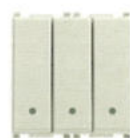
14003.SL Întrerupător triplu 20 AX - 2 module. Adâncime: 24 mm