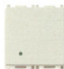
14042.SL Modul blanc - 2 module. Adâncime: 10 mm