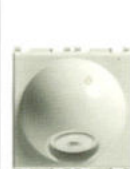
14046.SL 2 Colier cablu 20 A cu bloc de borne. Adâncime: 22,1 mm