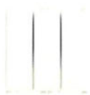
14003 Întrerupător triplu 20 AX - 2 module. Adâncime: 24 mm