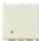
14002.2.SL 20 AX, - 2 module. Adâncime: 24 mm