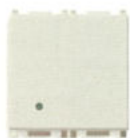
14000.2.SL 10 AX, - 2 module 14001.2.SL 16 AX, - 2 module. Adâncime: 24 mm