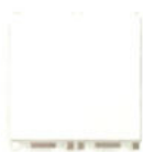
14000.FX.2 10 AX - 2 module 14001.FX.2 16 AX - 2 module. Adâncime: 25,7 mm