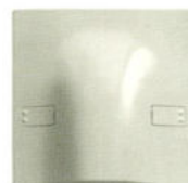
14047.SL 2 Colier cablu 45 A cu bloc de borne. Adâncime: 20 mm