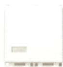
Δ 14000.7 10 AX, cu difuzor - 2 module. Adâncime: 24 mm