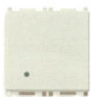
14000.FX.2.SL 10 AX - 2 module 14001.FX.2.SL 16 AX - 2 module. Adâncime: 25,7 mm