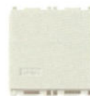
Δ 14000.7.SL 10 AX, cu difuzor - 2 module. Adâncime: 24 mm