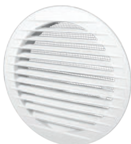
KRO Ø100 Ø125 Ø150