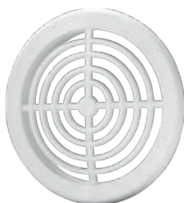
KRO Ø50 Ø75

VENTILATION GRILLE ВЕНТИЛЯЦИОННАЯ РЕШЁТКА